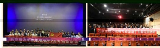
看红色电影，忆峥嵘岁月

为庆祝新中国成立72周年，纪念中国人民志愿军抗美援朝71周年，弘扬伟大的抗美援朝精神，缅怀为保家卫国献出宝贵生命的英雄烈士，