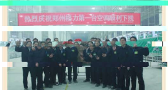
郑州格力第10万台空调下线