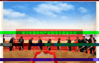
郑州格力投产十周年