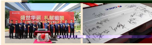
盛世华诞 礼献祖国 洛阳格力第300万台空调下线

9月，洛阳格力隆重举行第300万台空调下线仪式，彰显洛阳格力不忘初心、自力更生的坚持与本色。